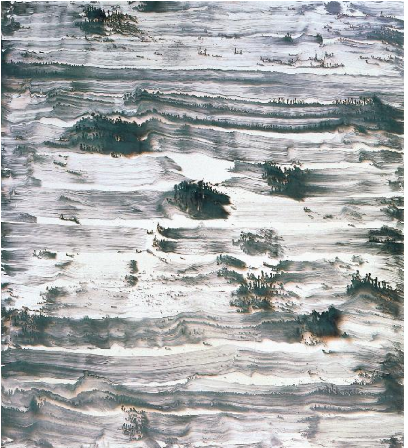
Bernard Frize Vony , 1993 Dispersion, résine et encre de Chine sur toile, 300 x 270 cm Collection du Fonds Régional d'Art Contemporain Bretagne / © Adagp