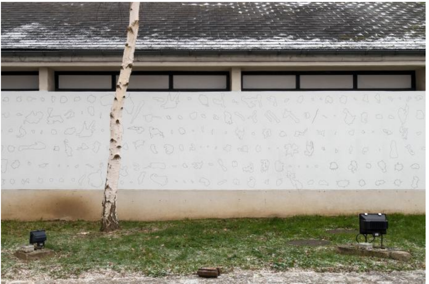
Aurélie Godard Un faible degrés de dess(e)in , 2009 centre d'art contemporain de la ferme du buisson / © Aurélien Mole