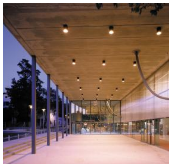
La médiathèque / la Strada Architecte Philippe Gazeau, 2001