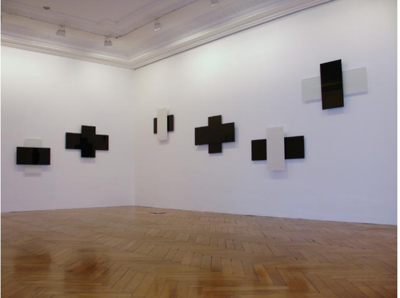
Emmanuel Ensemble de croix , 2004 Verre Hôtel des Arts de Toulon, 2005