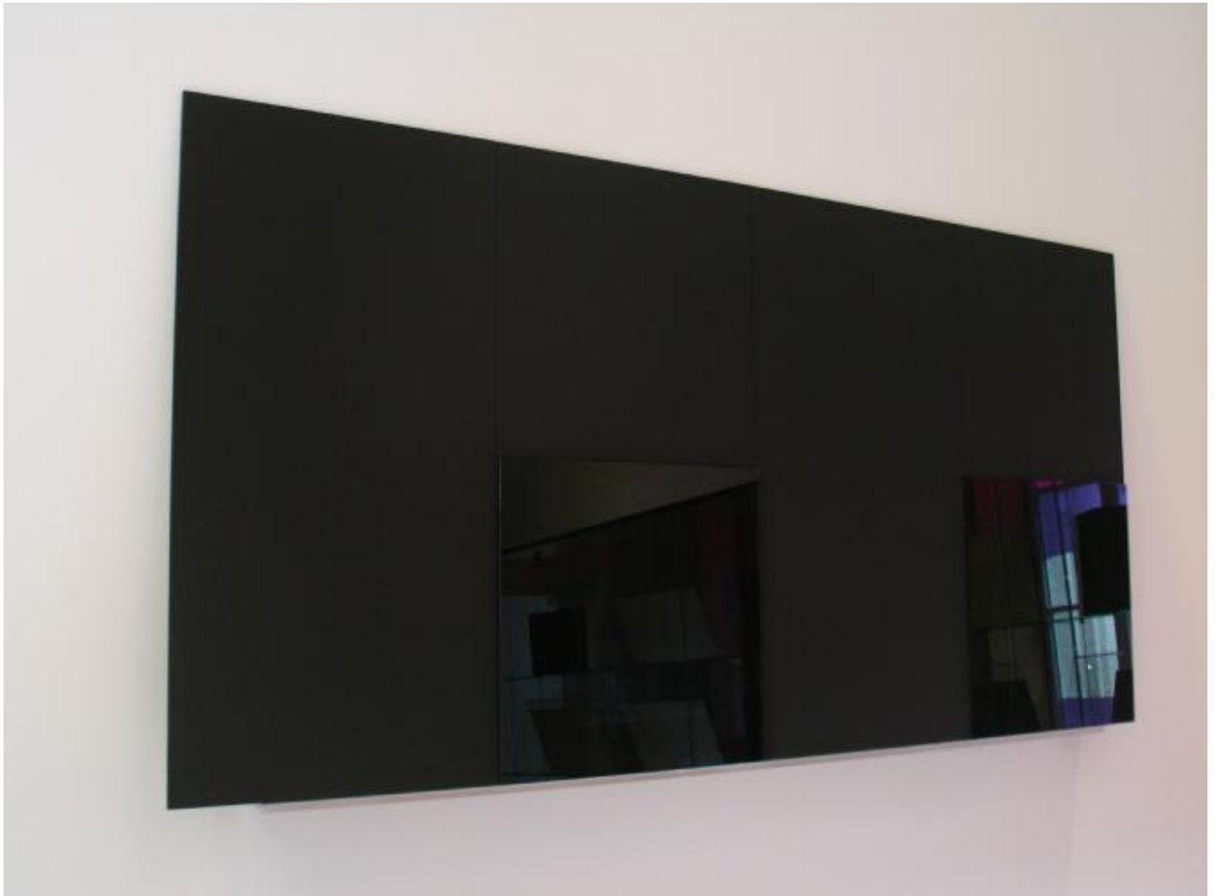
Emmanuel 07h16 Verre 80 x 160cm © Olivier de Branche