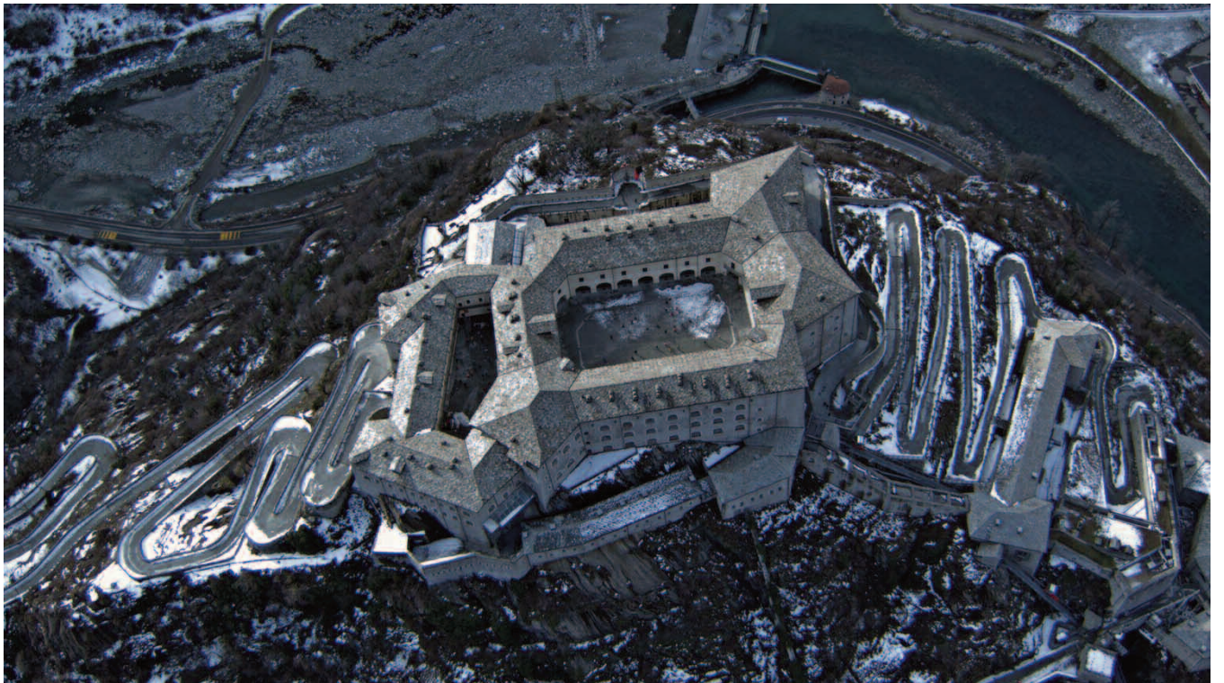
Mark Lewis , Forte! , 2010. 4K transferred to 2K, 6'. Film still courtesy and copyright the artist, Forte di Bard, Valle d'Aosta © Mark Lewis