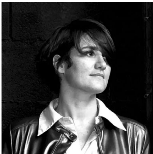
Anne-Valérie Gasc

L'œuvre d'Anne-Valérie Gasc est un surgissement souvent précédé d'un temps d'incubation qu'elle associe au silence avant l'explosion.