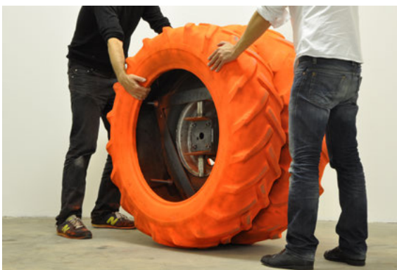
Anne-Valérie Gasc, Crash box , 2011